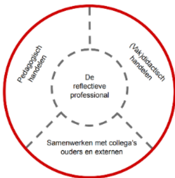
Figuur 1. Vier beroepstaken van de leraar

Deze onderwijseenheid richt zich op beroepstaak 4: de reflectieve professional .